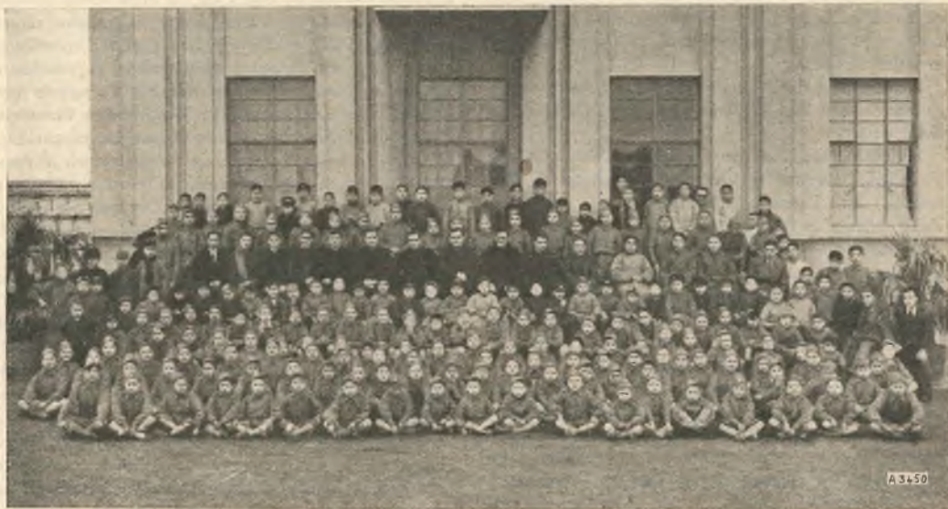
Shanghai (Cina). - Alunni interni dell'Istituto Don Bosco.

Speciale attenzione poi attira la costruzione della chiesa di San Giuseppe nella città di Mor. Ostrava. Data la poca stabilità del terreno a causa delle grandi miniere che si estendono sotto l'intera città, tutta