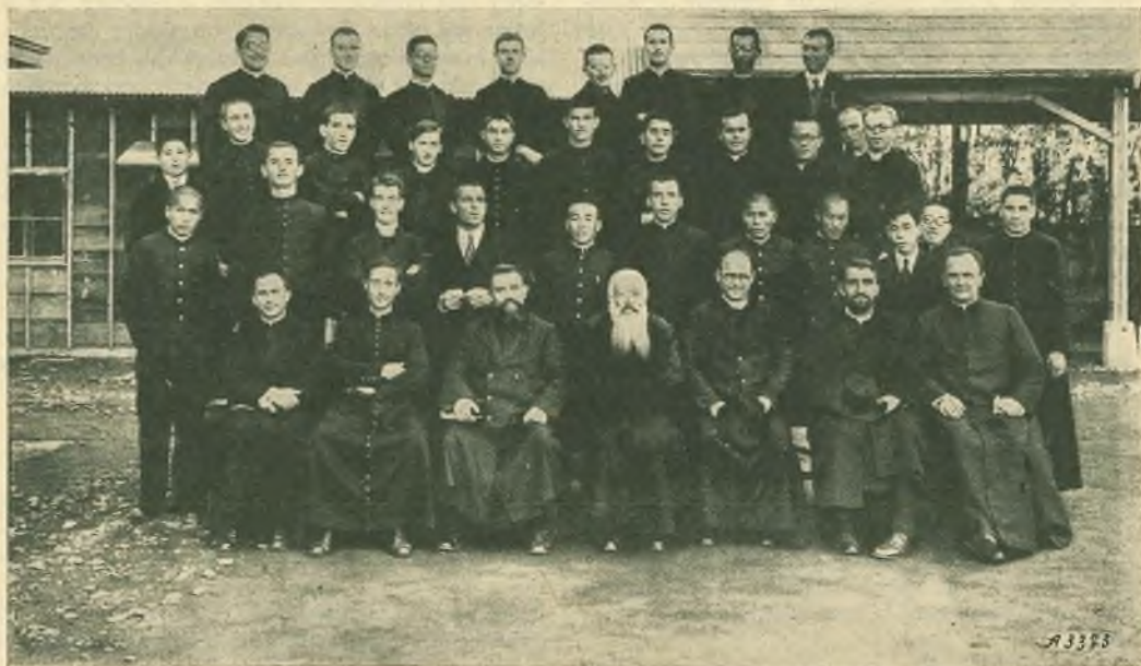
Tokyo. - La famiglia salesiana.