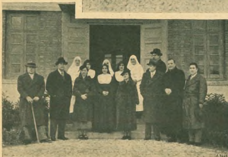
Alla Casa delle Figlie di Maria Ausiliatrice.