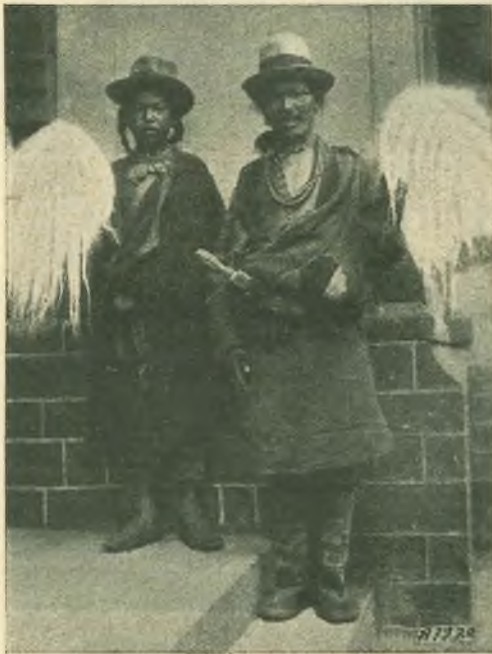
Assam. · Due Bhutanesi.