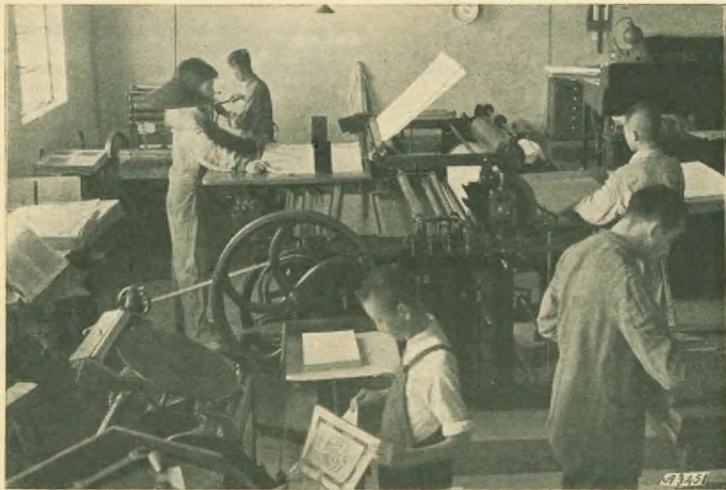
Shanghai - Istituto Don Bosco. - Un angolo della stamperia.