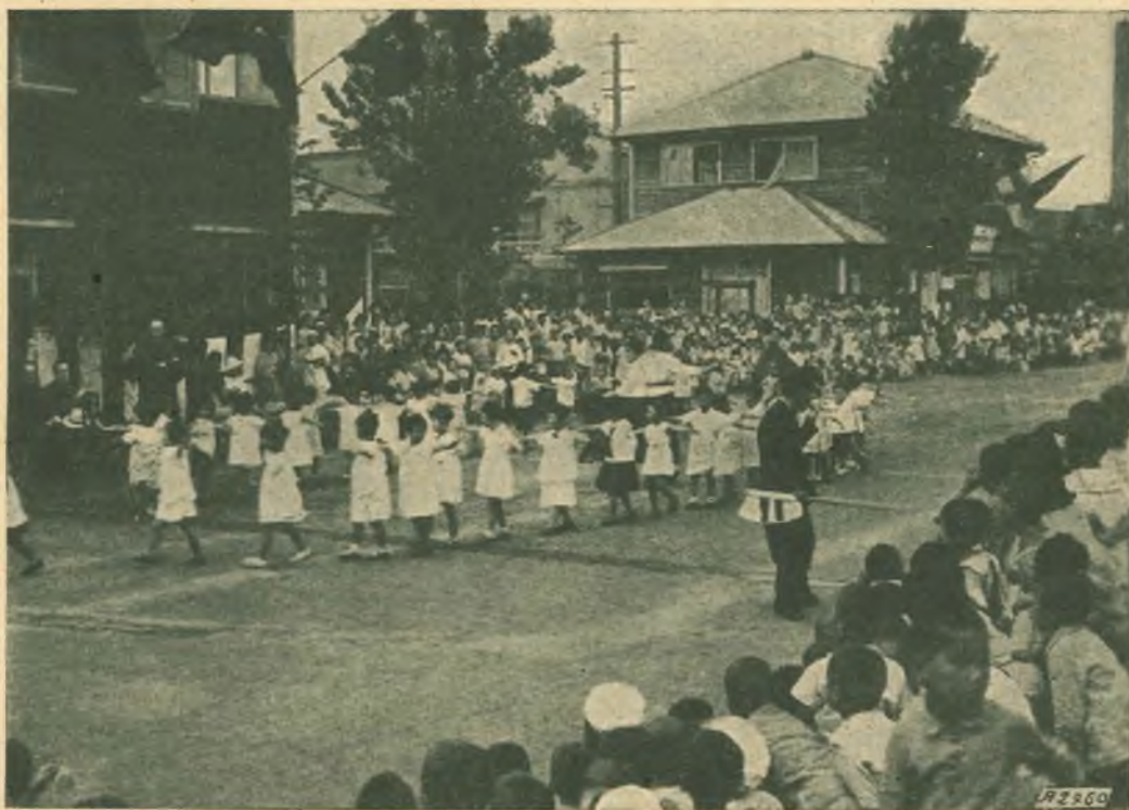
Tokyo. - Festa sportiva nel giardino d'infanzia.

mi intrattenga un poco su questo argomento di notevole importanza anche dal punto di vista dell'apostolato missionario, e le esponga quanto anche in questo campo dello spirito salesiano abbiano già operato i suoi figliuoli in Giappone.