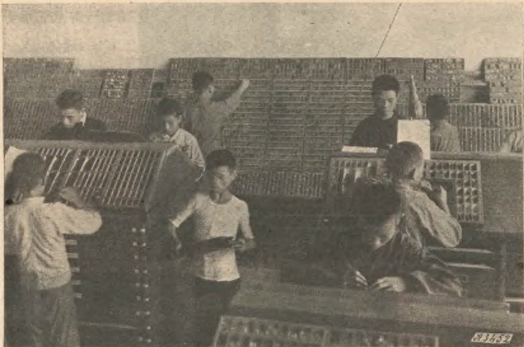
Shanghai - Istituto Don Bosco. - Un angolo della compositoria, reparto caratteri cinesi.

siana. Digitus Dei est hic . La Madonna accanto a Don Bosco, come in tutto il mondo, così anche nella Cecoslovacchia guidano l'Opera Salesiana di vittoria in vittoria. Imploriamo copiose benedizioni sopra tutta l'opera che i Salesiani svolgono a pro delle anime in tutto il mondo ed in modo particolare nella nazione cecoslovacca.