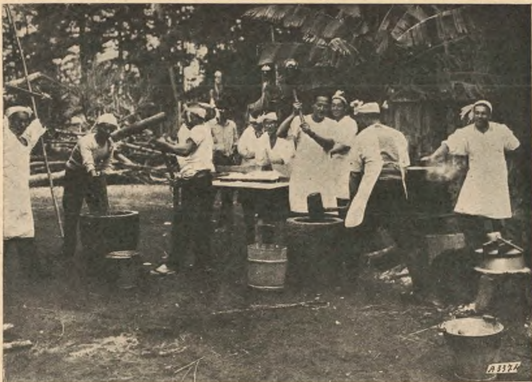
Miyazaki. - I giovani cattolici preparano il mochi (polenta di riso) per i poveri vecchi, il giorno di Capodanno.

di entusiasmi patriottici e simili. Gli attori sono pochi — da due a sei — preferibilmente tre, rafforzati alle volte dal coro, che sta in scena cogli attori e suonatori e che descrive la situazione, il paesaggio o deduce la morale.