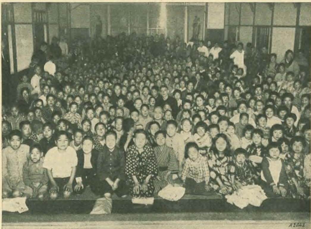
Tokyo. - I nostri oratoriani assistono al teatro.

estinzione. Accorsero pure i teologi e i filosofi... e, in breve, ogni pericolo scomparve.