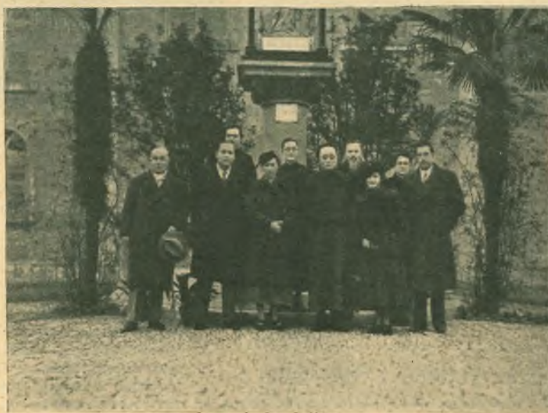
All'Istituto S. Giuseppe di Nantao.