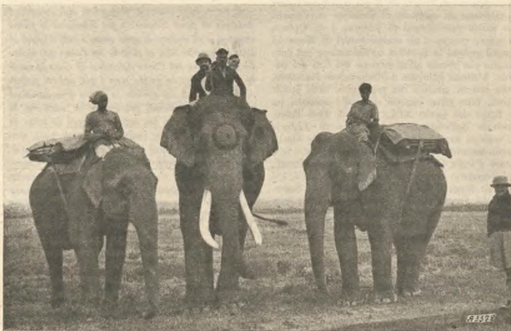
Assam. - I docili elefanti trasportano il Vescovo in visita pastorale.